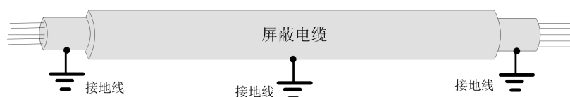
图 3 信号线接地示意图